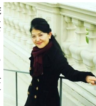
ベルヴェデーレ宮殿にて

武蔵野音楽大学卒業後、ポーランド政府給費留学生としてワルシャワのショパン音楽大学院へ留学。リオデジャネイロ国際音楽コンクール、最高位グランプリ受賞。ウィーン国際オペラコンクール最優秀伴奏者賞。ウィーン国立歌劇場でコレペティトアとしてムーティ、アバド、ショルティ等の指揮者の元で活躍。レナータ・スコット他著名な歌手との共演も多い。ピアニスト、作曲家としての活躍が広く、ウィーン楽友協会、パリのサル・ガヴォー、フランクフルト、ルクセンブルグ、プラハ国立歌劇場等、欧米アジアの著名なホールや劇場でのリサイタル、音楽祭等で招聘されている。ウィーン国立音楽大学で教鞭をとる傍ら、イタリア、スペイン他音楽大学からの招聘で、声楽とピアノ、室内楽のマスタークラスを開講。世界各国の後進の指導にあたっている。2018年ポーランド聖スタニスラフ勲章コマンドール賞受賞。2022年ローマの国際大会<イタリアと世界のボール・オブ・ザ・イヤー>で、初の日本人として文化功労賞の特別部門優勝。今後、日本での更なる活躍も注目されている。